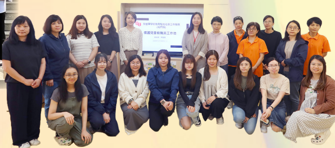
加強幼兒認識中華文化——教育局